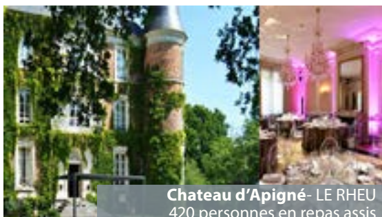
Chateau d'Apigné- LE RHEU 420 personnes en repas assis