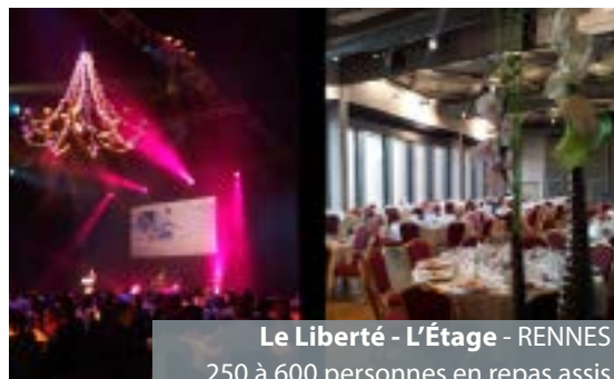
Le Liberté - L'Étage - RENNES 250 à 600 personnes en repas assis