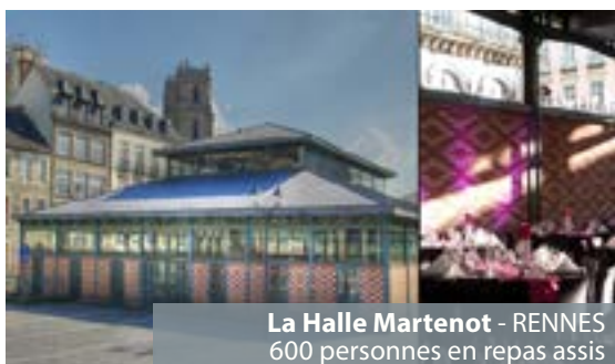
La Halle Martenot - RENNES 600 personnes en repas assis