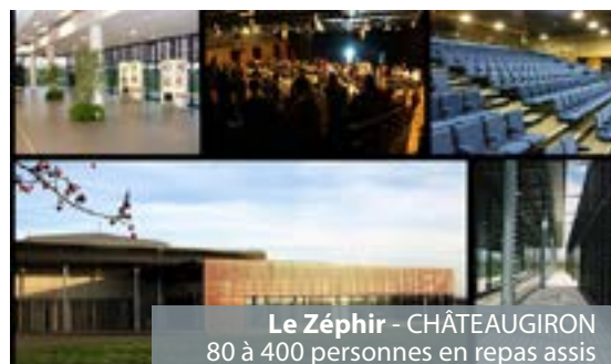
Le Zéphir - CHÂTEAUGIRON 80 à 400 personnes en repas assis