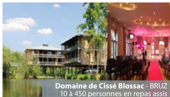
Domaine de Cissé Blossac - BRUZ 10 à 450 personnes en repas assis