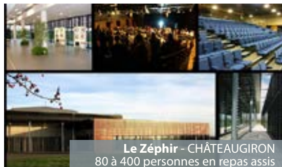
Le Zéphir - CHÂTEAUGIRON 80 à 400 personnes en repas assis