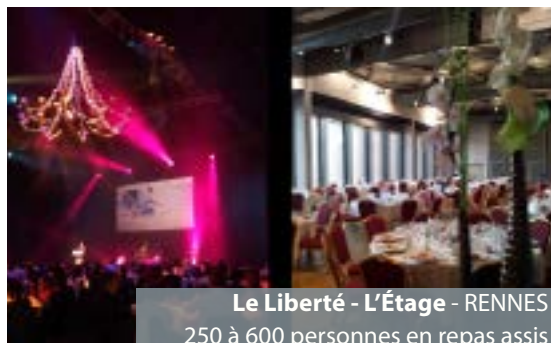
Le Liberté - L'Étage - RENNES 250 à 600 personnes en repas assis