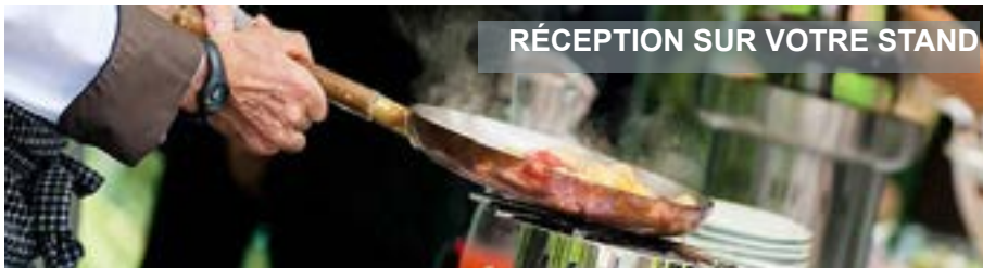
RÉCEPTION SUR VOTRE STAND

Fax : +33 (0)1 83 79 96 36 fraymond@carle-organisation.fr