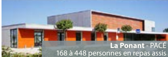
La Ponant - PACÉ 168 à 448 personnes en repas assis